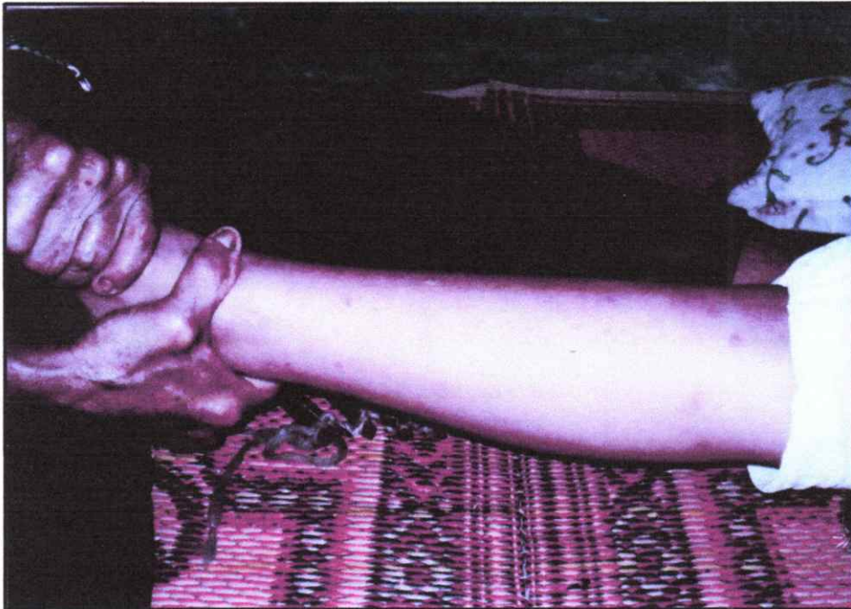
ตั้งให้ตรงกัน