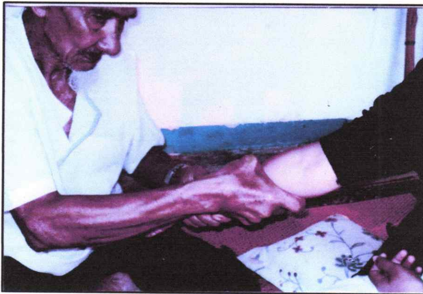
จับกระดูกดูว่าอาการเป็นยังไง