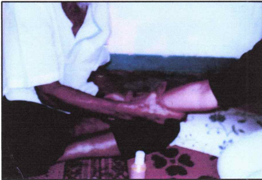
นวดน้ำมันงา